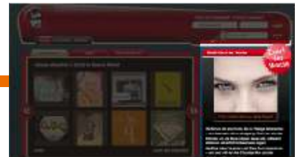
E-Card der Woche