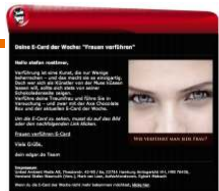
E-Card der Woche (Directmailing)

Stand-Alone-Directmail (E-Card der Woche)