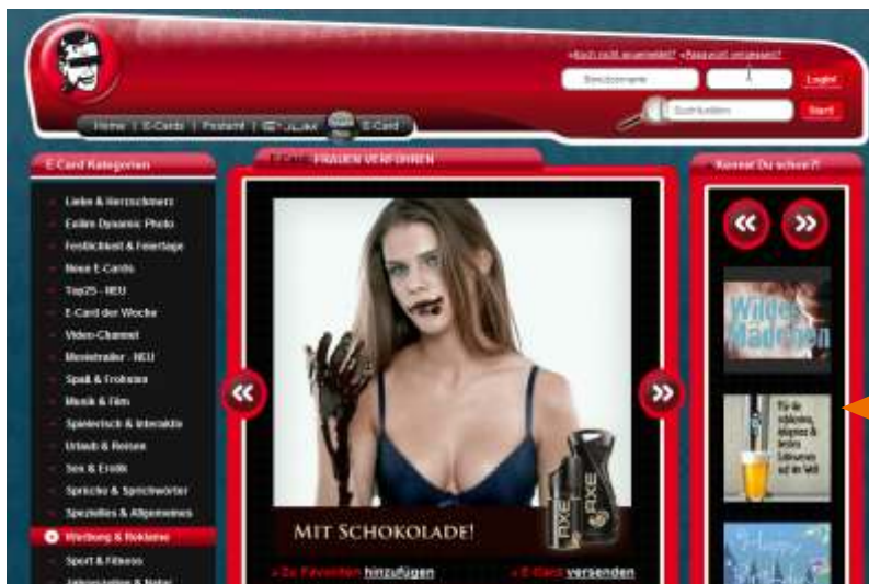
Ihre E-Card auf Edgar.de

Der Link zu Ihrer E-Card auf Edgar.de wird per Stand-Alone-Directmail an satte 700.000 registrierte User verschickt. Das heißt Traffic pur. Wem das noch nicht genug ist, kann über unsere Teaserbuttons auf der Homepage oder in den spezifischen Rubriken für zusätzliche Klicks sorgen.